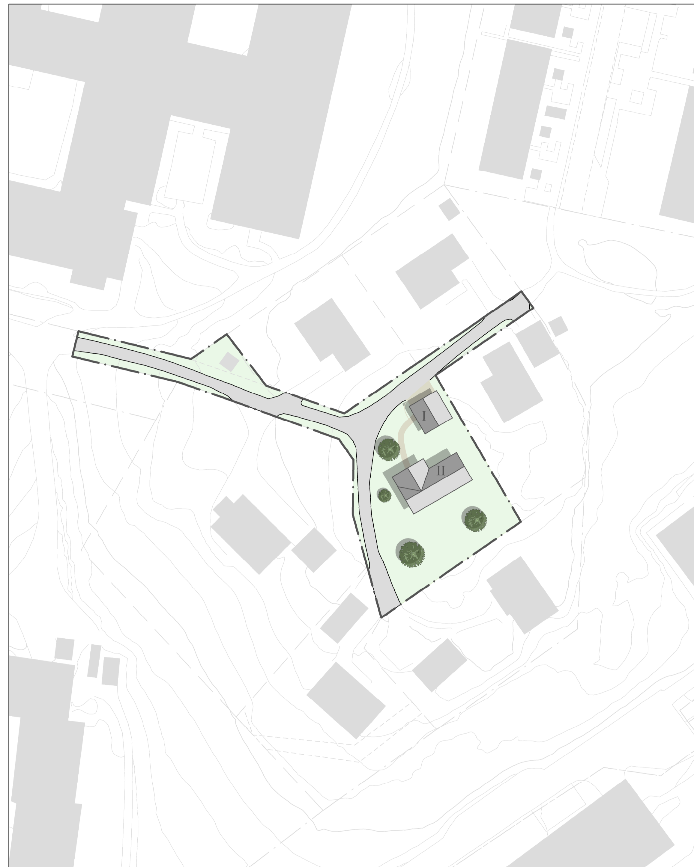
ILLUSTRATION Skala:1:500 (A1)